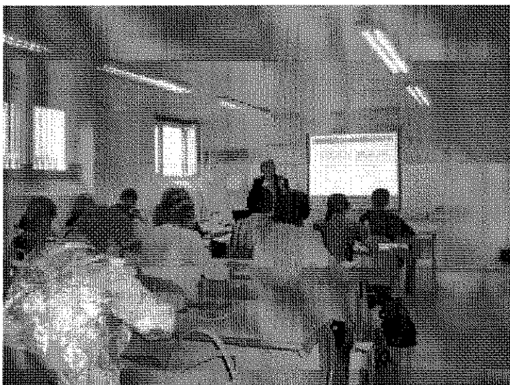
Slika je simbolična.

LJUBLJANA - Evropsko leto prostovoljstva in Mednarodno leto gozdov sta osrednji temi, ki bosta označevali dogodke ob Tednu vseživljenjskega učenja. Aktivnosti se bodo pričele v ponedeljek in se bodo odvijale do petka, pripravlja pa jih vrsta organizacij po celi Sloveniji.