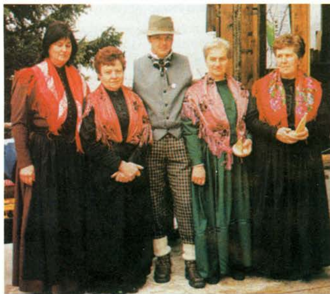
Del skupine v tradicionalni noši

Po šestih letih, so nam povedale, ne počivajo. Skupina se je celo povečala za pet članic. V tem času so ustanovile pevski zbor in z veseljem se odzovejo na povabila za nastope. Ob koncu leta vedno zaigrajo kakšno igro ali skeč za sokrajane, priredile pa so tudi kar nekaj razstav – na temo lanenih oblačil, klekljane čipke in pa, kar je še posebno zanimivo, življenjskih zgodb izseljenk domačink. Razstavljale so tudi stara in nova peciva in priredile tri proslave. Vse njihove prireditve so zanimive tudi zato, ker znajo praktično prikazati dejavnosti. Septembra bo pri krajevnem spomeniku v njihovi organizaciji nastopilo osem zborov iz različnih krajev. Učijo se novih stvari in k temu znajo pritegniti tudi sokrajanke. Še vedno pa pridno skrbijo za lepoto in urejenost svojega kraja.