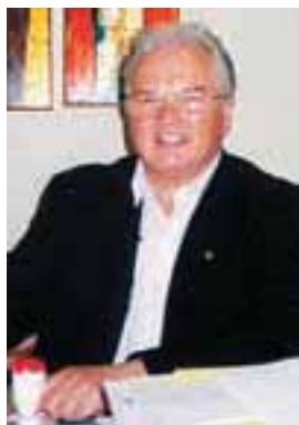
Slovenska hiša - hiša učenja in srečanj, hiša dialoga

Predlagatelj: Ministrstvo za kulturo Republike Slovenije, Sektor za slovenski jezik, in Društvo katoliških pedagogov Slovenije