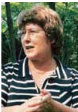
Prava beseda pravo mesto najde

Profesorica slovenskega jezika in književnosti se je od poučevanja na osnovni in srednji šoli podala v negotove vode izobraževanja odraslih. Prve programe za odrasle je začela izvajati na UPI Ljudski univerzi Žalec. Več let je bila strokovna sodelavka Andragoškega centra Slovenije, potem pa ustanovila lastno izobraževalno podjetje.