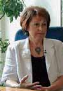
V službi ljudi ob Dravi

22 učenje, študijskih krožkov in univerze za tretje življenjsko obdobje. Andragoški zavod Maribor je izbrana organizacija za zunanje preverjanje znanja tujih jezikov ter nosilec licence Goethejevega inštituta za severovzhodno Slovenijo. Z razmahom višjega in visokega šolstva je postal študijsko središče treh visokošolskih zavodov. Je izvajalec usposabljanj po certifikatnem sistemu in programa 10.000+.